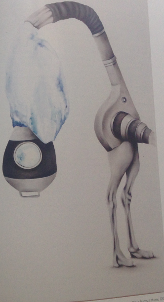
Duun İstisnası Mumu (2019)

Genelde kişisel sergiler sonrası bir makarının parçası gibi bir öncekinin devamı oluyor. Ancak karma sergilerde bu makara diğer makaralarla karşıyor ve ortaya yeni ve bambaska hatta beklenmedik tesadüfler çıkarabiliyor. Ne hikaye? İsmi sergimde olduğu gibi, "Tentuz" a kadar Kasa plendeydi.