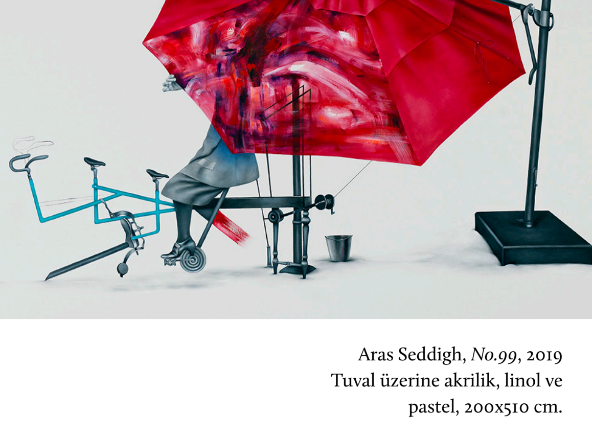
Aras Seddigh, No.99, 2019 Tuval üzerine akrilik, linol ve pastel, 200x510 cm.